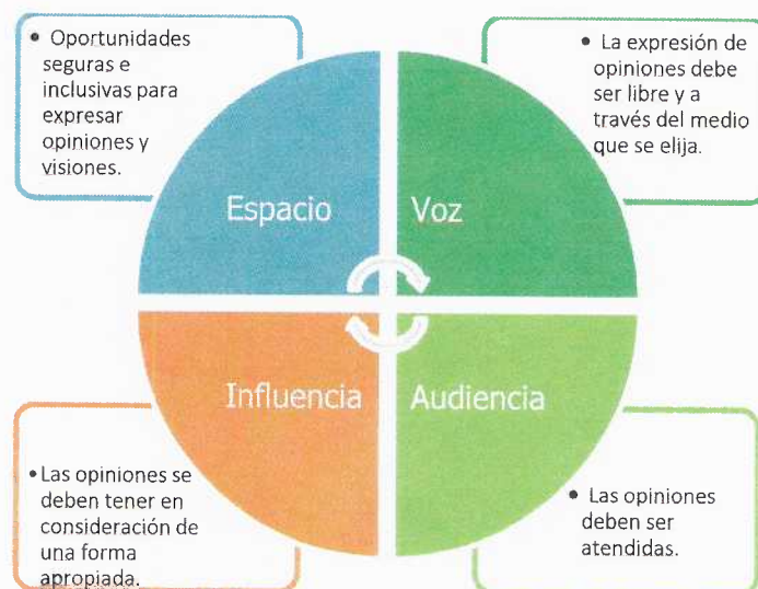
Figura N°2: Elementos para la participación efectiva y significativa

Fuente: Conceptual Framework for Measuring Outcomes of Adolescent Participation. UNICEF (2018).