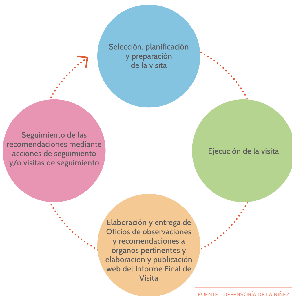
ILUSTRACIÓN 1 | PROCESO GENERAL DE VISITAS

El diseño de los protocolos de seguimiento e instrumentos de retroalimentación, se realizaron teniendo en cuenta el proceso general de visitas establecido por el equipo de la Defensoría de la Niñez, el cual se presenta a continuación en la ilustración 1.