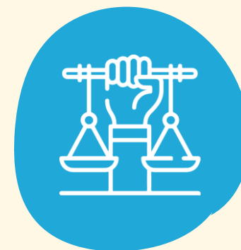
Igualdad y no discriminación

Estos Pilares deben estar presentes en todo el accionar de la Defensoría.